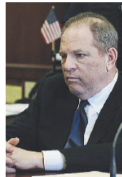
IN AULA H. Weinstein

In aula Weinstein si limita a poche parole, sì e no. È pallido. Non risponde alle domande urlate dai giornalisti fuori dal tribunale. Finita l'udienza lascia il tribunale e nel giro di pochi minuti rientra in auto e si allontana. L'ex produttore star è stato accusato complessivamente da oltre 70 donne di molestie: accuse che hanno dato vita al movimento #MeToo.