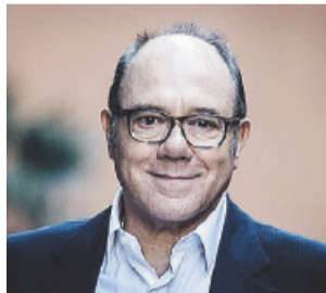
OGGI Carlo Verdone